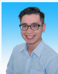
香港社會服務聯會家庭及社區服務主任