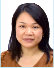
《社聯政策報》編輯委員會成員