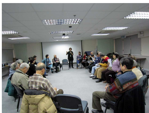
聯席主持地區交流會、地區論壇及培訓的情形