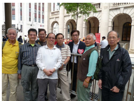
聯席代表利用不同方式表達長者訴求