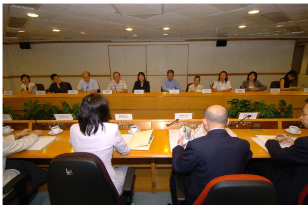
聯席代表與不同之政府官員及立法會議員會面